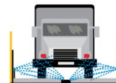
Rys. 3. Myjnię dla pojazdów budowy